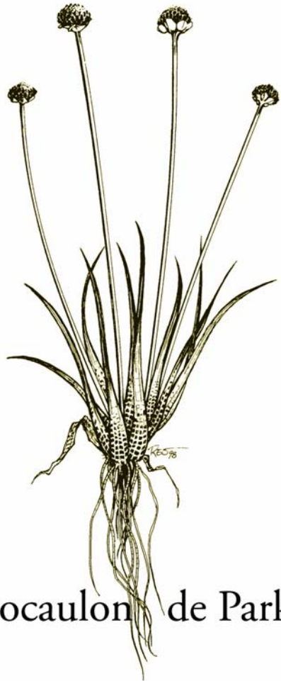
Eriocaulon de Parker

Nom scientifique: Eriocaulon parkeri Situation au N.-B.: Menacée