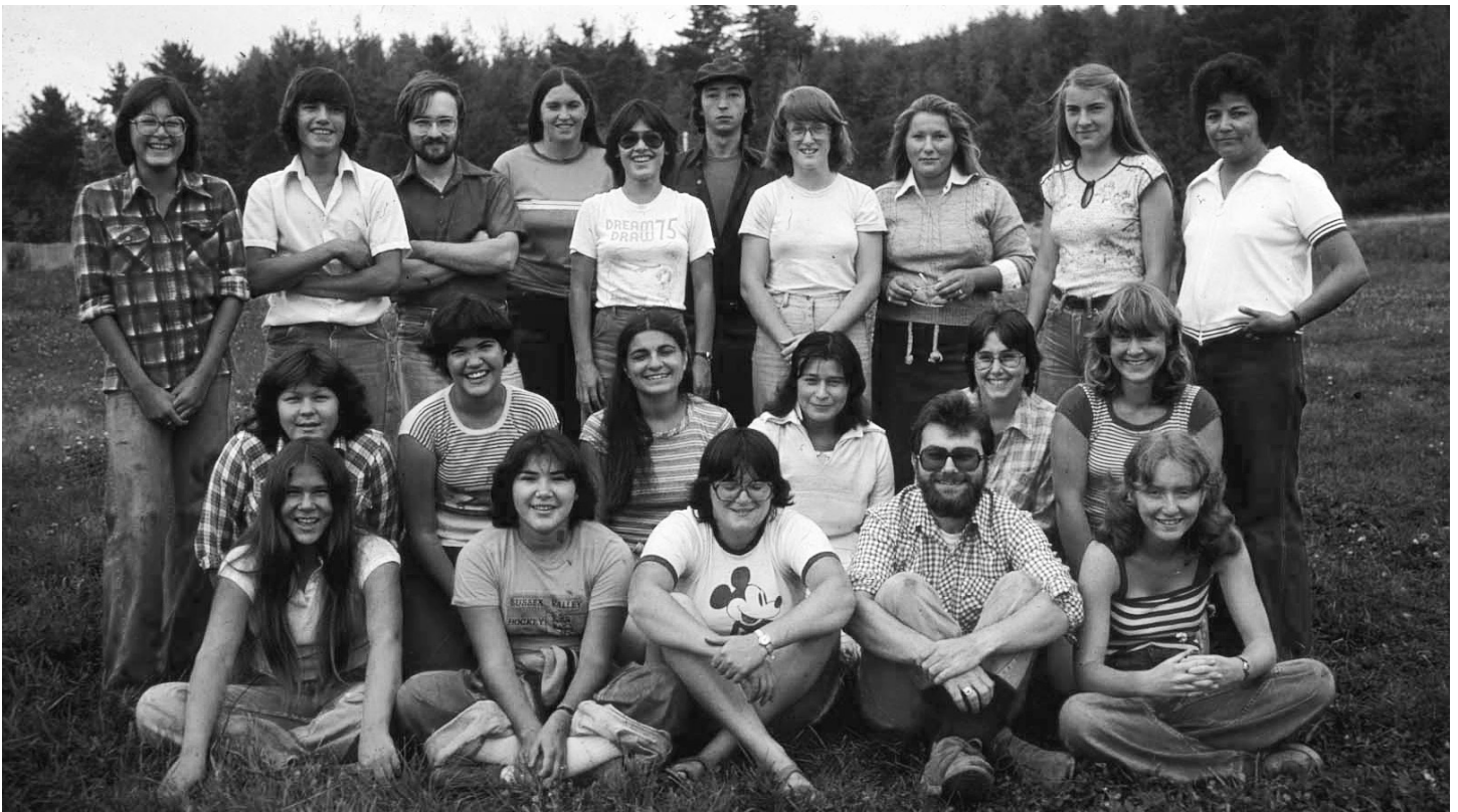
Équipe d'archéologie et d'exposition de Metepenagiag (1979).

Quelques mois avant l'impression du livret, il s'est présenté une autre occasion d'annoncer publiquement