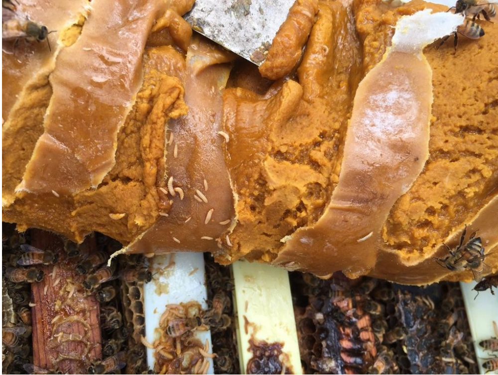
Figure 7. Des larves de petit coléoptère des ruches sous une galette de pollen (photo prise dans un rucher en Ontario).