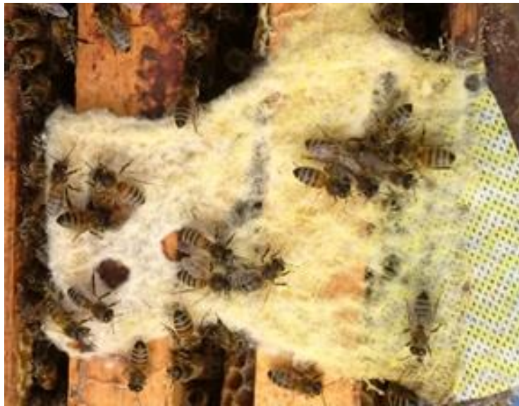
Figure 2. Des abeilles domestiques mâchent le piège en tissu Beetle Bee-Gone, ce qui pour effet d'effiloche les fibres.