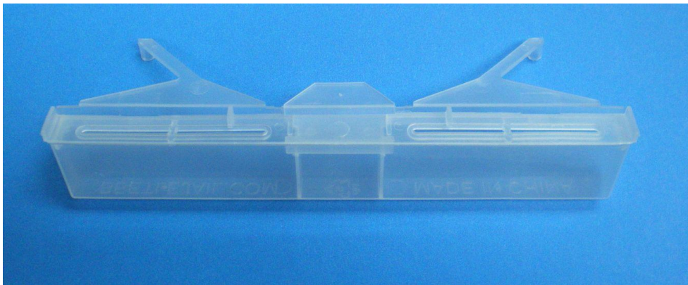
Figure 4. Piège par immersion Beetle Jail.