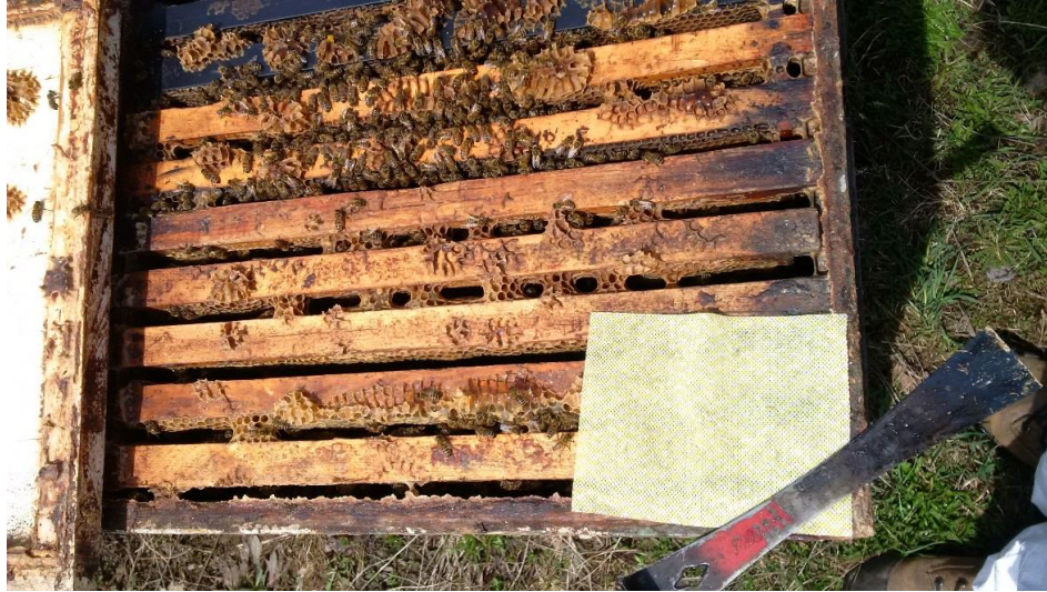
Figure 1. Piège en tissu Beetle Bee-Gone posé sur le dessus des cadres à couvain et placé dans le coin de manière à recouvrir le bord intérieur du corps de ruche.