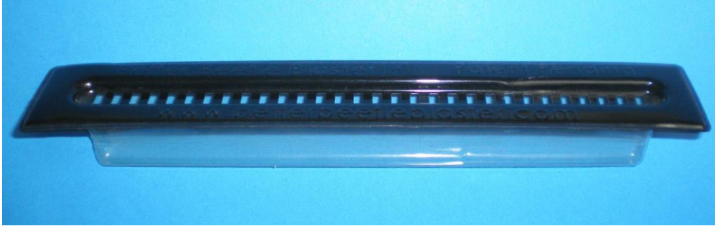
Figure 3. Piège par immersion Better Beetle Blaster.

il est important de soumettre un échantillon des coléoptères piégés afin de les faire identifier.